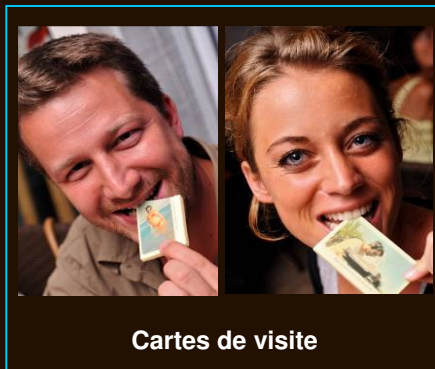
Cartes de visite