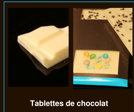
Tablettes de chocolat